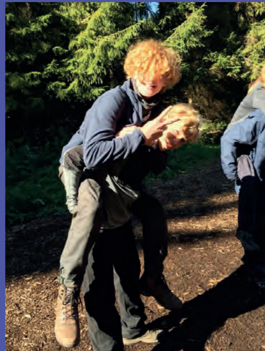
Friluft på tur.

Samarbejdsøvelser kan godt være sjove, når man går på efterskole.