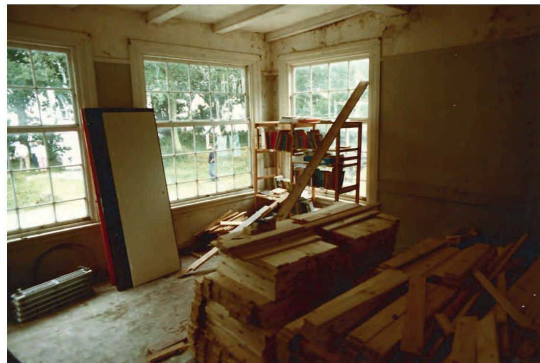
Stabler af brædder lå klar til eleverne, og der var også indkøbt stof til at sy gardiner.