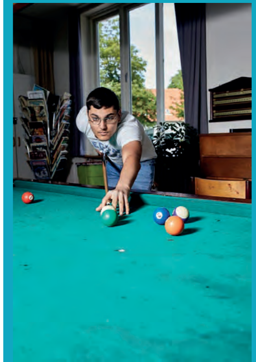
Elevrummet med pool – i år betalte elevkassen for en renovering af klædet.

Hvordan er livet på en moderne efterskole? Ikke så dårligt, hvis man skal tro billederne på disse og den følgende side.