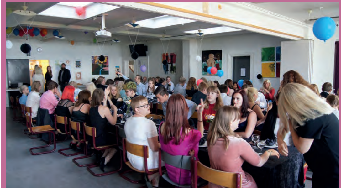
Den sidste uge på Faxehus byder som altid på flotte kjoler og nystrøgne skjorter til gallafesten.