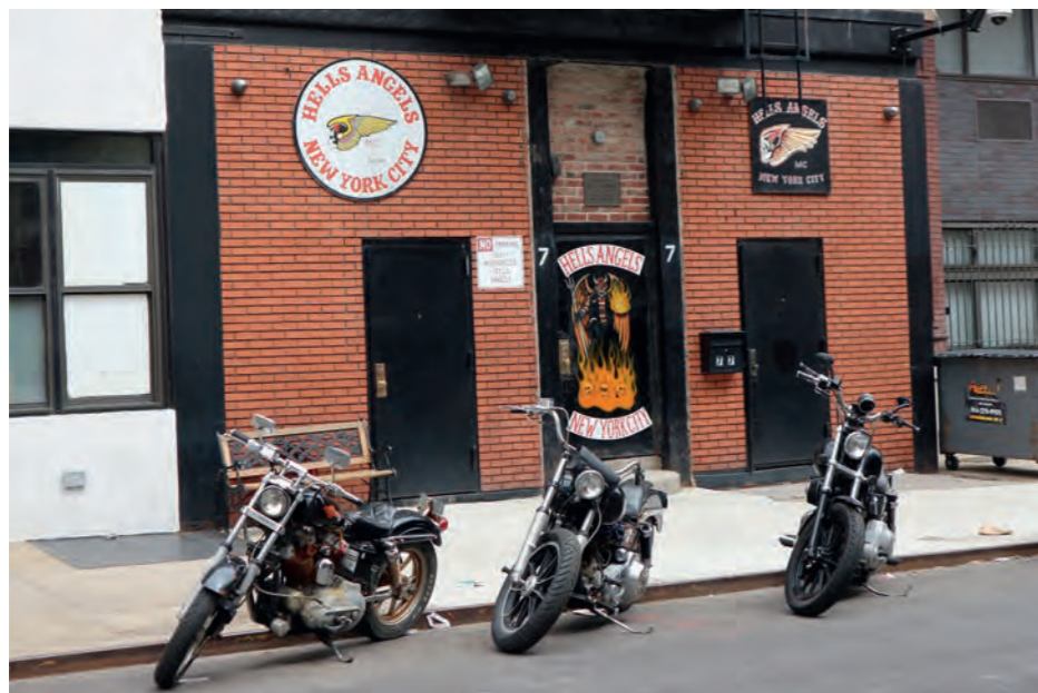
En øredøvende larm fra motorcykler skar sig gennem den stille aften i Faxe Ladeplads...