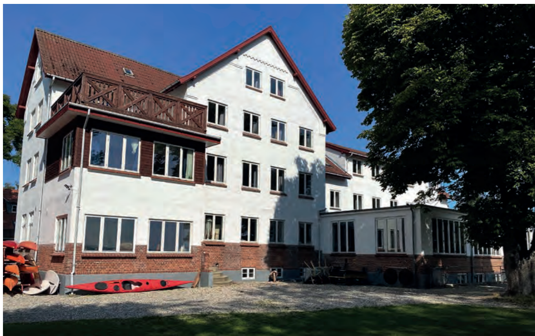
Sådan ser efterskolen ved vandet i Faxø Ladeplads ud i dag - men det var et noget andet syn, der mødte de første elever i 1980. Læs om tilblivelsen af Faxehus side 6-9