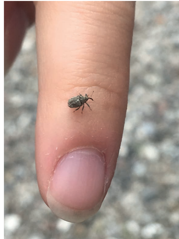
Snudebillen her er et af de smådyr, der er blevet føjet til artslisten i de seneste år.

hinanden, og udstyret med deres mobiler kan eleverne tage billeder af alt muligt, som det så handler om at identificere. Så jeg kan roligt sige: Jeg lærer noget nyt hver dag! •