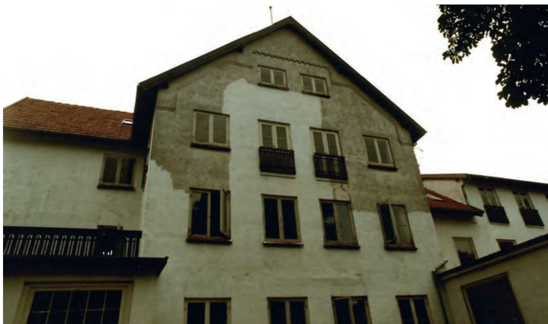
Lærerne havde haft travlt med at gøre skolen klar til første årgang. Og det kunne ses.