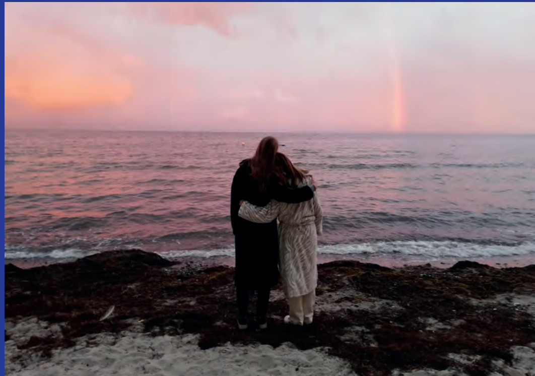
Noget af det smukkeste ved Faxehus er en sommeraften på stranden med regnbuer og solnedgang.