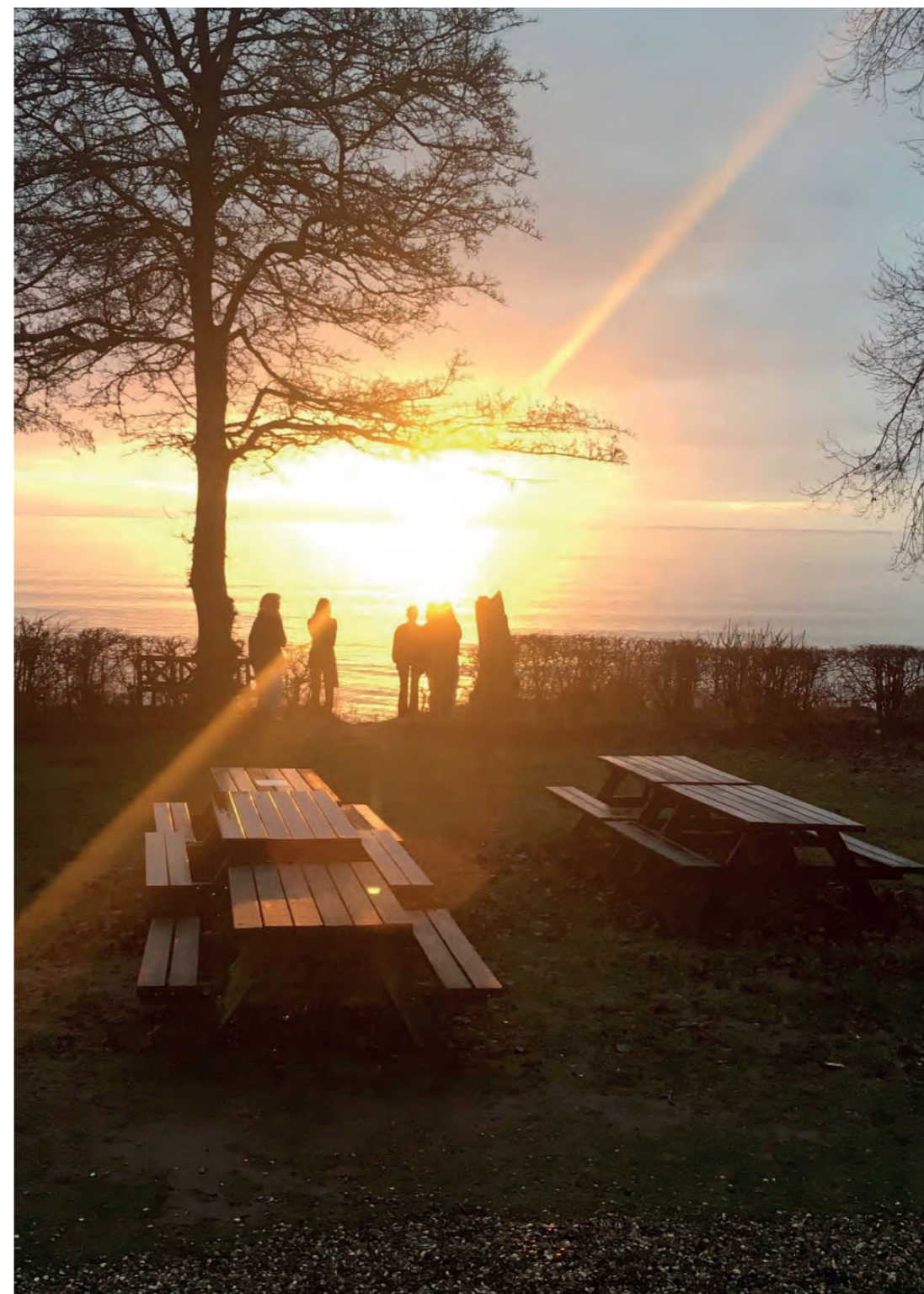
Fra socialistisk efterskole med kollektiv ledelse til internationalt udsyn og FN's verdensmål. Se nedslagene i Faxehus' udvikling side 14-17